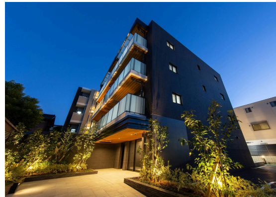
オープンレジデンス桜山ヒルズ

多くのお客様にお選びいただけているのはお客様のニーズにお応えした物件、サービスを提供し続けてきた結果だと思っております。今後もニーズの変化にいち早く対応し、いつまでも選ばれ続けるマンションディベロッパー、不動産会社として精進してまいります。